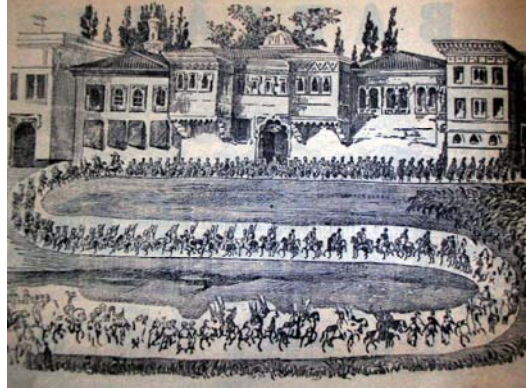
Şekil 2. 1802'de Konstantin Ypsilanti'nin Bab-ı Ali'ye kabulü. (5)

Babıali'nin 19. yüzyıl başlarındaki şekli hakkında bilgi veren bu metne göre bina aşağı yukarı şöyledir: Bu gün ortadaki Şura-yı Devlet dairesinin yanmasıyla iki parçaya ayrılmış bina eski durumunda da Nallı Mescit'ten Babıali kapısına kadar uzanan vaziyette olup harem ve selamlık daireleri, ahırlar, anbarlar, silahhane ve cebehane, geniş avlu ve bahçelerinden oluşan bir alana kurulmuştu. Alay Köşkü karşısındaki ana kapıdan girince avlu ve bahçeleri yer alıyordu. Avludan Nallı Mescid yani Babıali yokuşuna çıkılacak bahçe kapısı ve bu bahçe gibi meydana çavuşbaşı, tevkii, telhisçi daireleri ve Nallı Mescit Mahallesine bakan divanhane ve bunun merasim kapısı vardı. Nallı Mescid'in etrafında evlerin yer aldığı ve bu isimle anılan mahalleden, dar bir geçitten resmi kapıların açıldığı meydanlığa geçilirdi. Vezirler için olan Bab-ı Asafi ve binek taşı da burada idi. Beşir Ağa Cami ve sebilinin önündeki dar ve çıkmaz bir sokağın ucunu harem kapısı olan, tomruğun arka kapılarını oluştururdu. Nallı Mescid tarafından bile tomruğa gidilen ve aynı mevkinden çavuşlar, kavaslar ve seyisler dairelerine, aile ve maiyetlerinin geçmesine mahsus olan çeşitli kapılar olup harem ile selamlığın birleştiği yer olan ikiyüzlü sofalar burada idi. Vezir dairesi bu kısmın üzerinde olup dairenin buradan Ayasofya'ya uzanan kısmı reis ve kethüda dairelerinden oluşurdu. Şengül yokuşuna ve Fatma Sultan mektebi sokağına sebil, cami ve kütüphaneye karşı olan kısımların sokağına bakan şahnişinleri vardı.