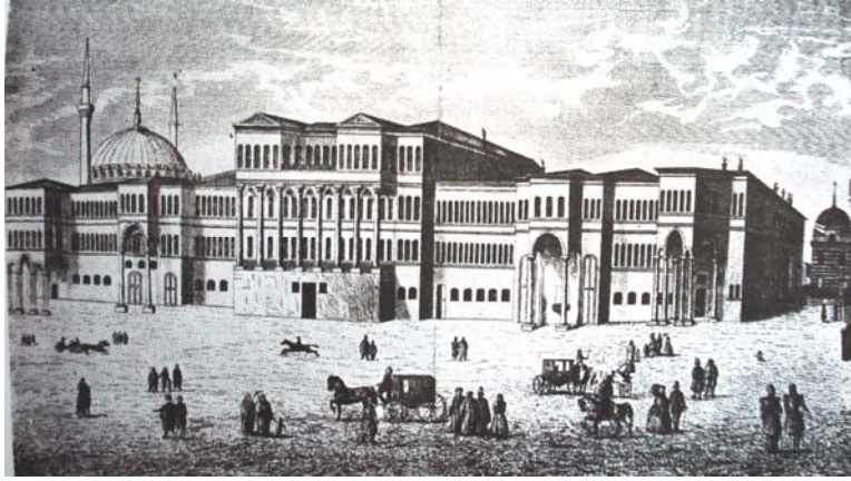
Şekil 3. Babiali binası (14 Kanun-ı Sani 1867 tarihli Ayine-i Vatan Dergisi)

Babiali'nin kagir olarak inşasından sonra 1878 yılında büyük bir yangın geçirmiştir. Yangın sonrası binada tamir yapılmıştır. 1879 yılında, 1878 Babiali yangınında binanın yanan kısmının Şehremaneti tarafından onarılması için "sermimar-ı devlet Serkis Bey" tarafından keşif, (14) onarım işinin de Vasilaki Efendi kalfaya havale edildiği bilinmektedir. (15)